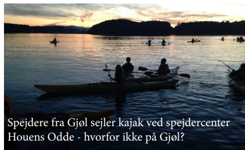
Spejdere fra Gjøł sejler kajak ved spejdercenter Houens Odde - hvorfor ikke på Gjøł?

Vi forventer også, at der vil være dagtilbud med en høj faglig profil som svarer til den service som forældre i Nørhalne og Biersted tilbydes. Desuden ønsker vi at kunne sikre børnefamilier dagtilbud på Gjøł.